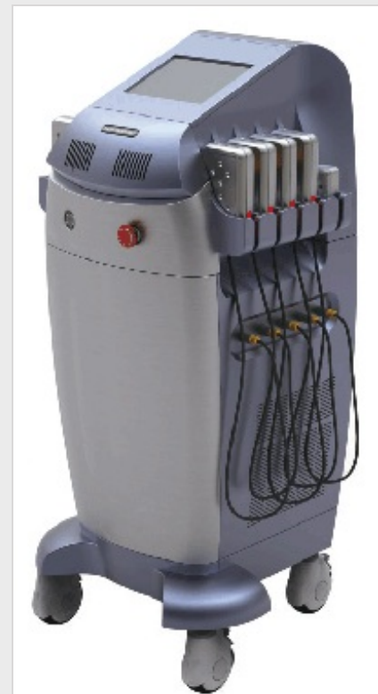
LipoLaser Body Slimming FG 660H-001

Die Lipo-Laser-Behandlung wird auch zur Behandlung von Cellulite eingesetzt. Ebenso soll ein